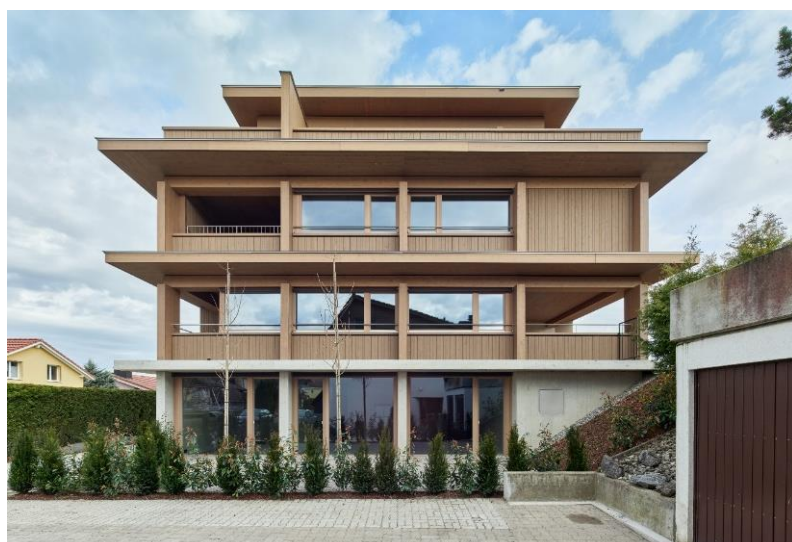
Haus Totoro, Gunzwil