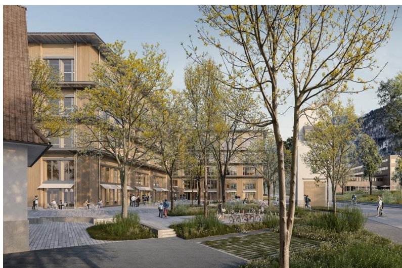
FHZ Graubünden, Chur (Visualisierung: Giuliani Hönger Architekten)

Ausführliche Informationen zum Büro findest du unter www.luechingermeyer.ch .