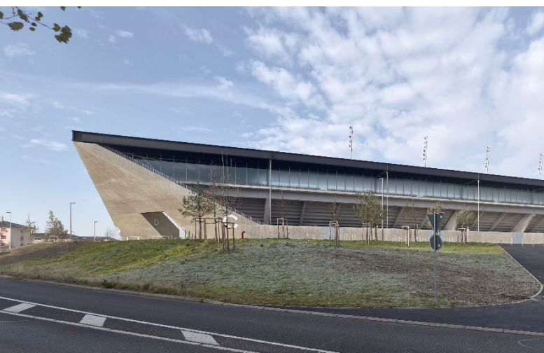
Stade de la Tuilière, Lausanne

Esperamos recibir su candidatura por correo electrónico a madrid@luechingermeyer.ch o a través de LinkedIn.