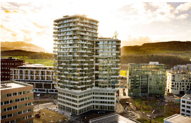
Aglaya – Wohnturm Suurstoffi, Rotkreuz

Esperamos recibir su candidatura por correo electrónico a madrid@luechingermeyer.ch o a través de LinkedIn.