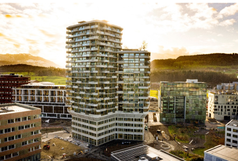
Aglaya – Wohnturm Suurstoffi, Rotkreuz